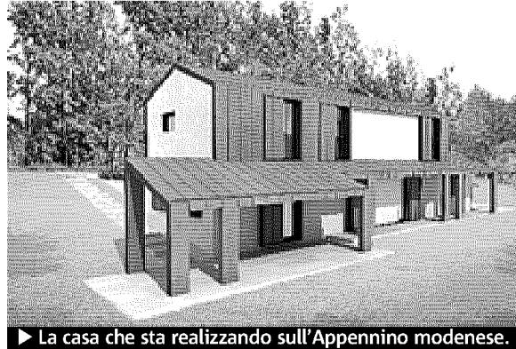
► La casa che sta realizzando sull'Appennino modenese.

Perché il legno rappresenta il futuro dell'edilizia residenziale in Italia?